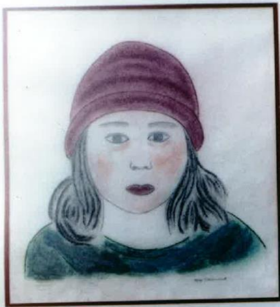
Œuvre de Marie Vaillancourt, artiste en résidence.