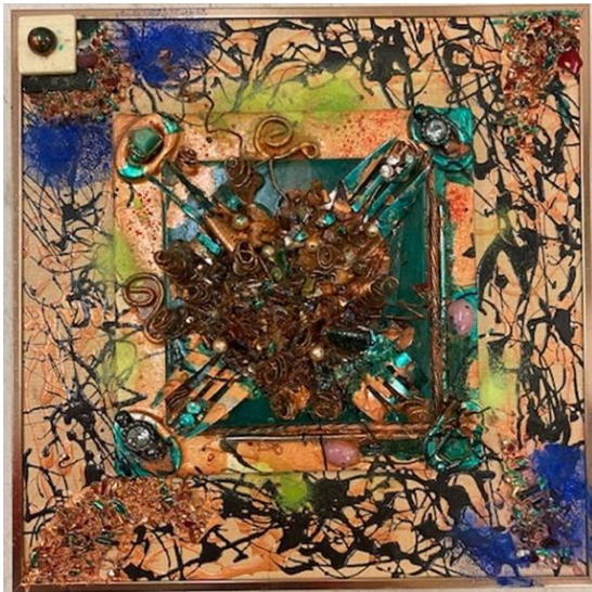
Œuvre de Gilles Doyon, assemblée à partir de matériaux recyclés